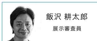
飯沢 耕太郎 展示審査員

写真評論家。「写真的思考」「増補 戦後写真史ノート」など著書は50冊を越え、「アサヒカメラ」等の雑誌でも執筆している。「写真新世紀」を始め、多くの写真コンテストで審査員を歴任。現在最も影響力の強い写真評論家といわれる。