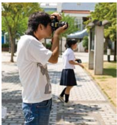
ワークショップの撮影の様子

このワークショップは、参加者全員が写真作品を応募することを目的に行います。応募作品は、ワークショップ内で制作したもの以外に、過去のワークショップ参加者からも募ります。ワークショップは2日間の日程で行います(A・Bコース)。また、過去のワークショップ参加者を対象に、講師による講義や、各自で持参した作品の講評時間を設け、更に発展したレクチャーを行います(Cコース)。