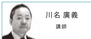
川名 廣義 講師

写真評論家。「写真的思考」「増補 戦後写真史ノート」など著書は50冊を越え、「アサヒカメラ」等の雑誌でも執筆している。「写真新世紀」を始め、多くの写真コンテストで審査員を歴任。現在最も影響力の強い写真評論家といわれる。