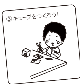
③ キューブをつくろう!